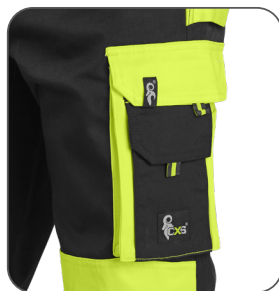
multifunkční vaková kapsa multifunctional sac pocket kieszeń wielofunkcyjna