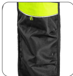
zdvojená kolena s možností vložení kolenních výztuh reinforced knees with possibility to insert knee pads podwójne kolana z możliwością włożenia nakolanników